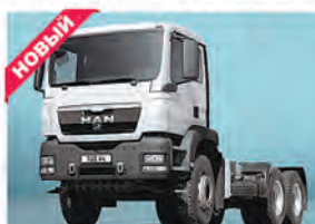
MAN TGS 33.430 (6x4) BBS Кабина L, 2012 г/в, 440 л.с., кондиционер