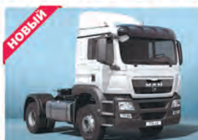
MAN TGS 19.400 (4x2) BLS Кабина L, 2012 г/в, 400 л.с., кондиционер