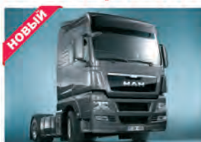
MAN TGX 18.480 (4x2) VIP Black Special Edition, кабина XXL, климат-контроль